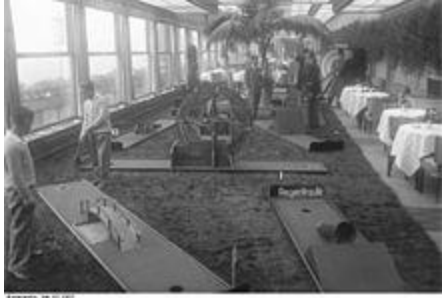
Mini golf course on the roof of the Eden Hotel

The Eden-Hotel was located at the historical address Kurfürstendamm 246/247 on the street triangle Budapester Straße / Kurfürstenstraße / Nürnberger Straße opposite the Zoo-Aquarium . After renaming the Kurfürstendamm section in Budapester Straße was the address Budapester Straße 18. Today is located at this point the Olof-Palme Square . Regular guest at Berlin stays was the writer Jakob Wassermann . The hotel's bar was considered one of the city's most elegant, with high prices. Here met successful writers, actors and artists such as Heinrich Mann , Albert Bassermann , Gustaf Gründgens or Erich Maria Remarque , but also Wilhelm Herzog [4] and Marlene Dietrich [16] . The painter Max Beckmann documented the bar in 1923 in a woodcut called group portrait Edenbar ; Christopher Isherwood describes in his Berlin Stories a conversation with the German aviator Fritz Wendel , which took place here. To the hotel's fame came in 1919. At this time was here the headquarters of the Guards Cavalry Rifle Division . On January 15, 1919, the illegally arrested Karl Liebknecht and Rosa Luxemburg were deported there, and at 10 pm of the day the decision was made to assassinate them. While Luxemburg was shot a few yards from the hotel, and her body was thrown into the nearby Landwehr Canal, Liebknecht's murderers took the body back from its execution site in Tiergarten back to the hotel and handed it over to the hotel as an "unknown corpse".