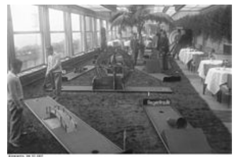
Minigolf-Platz auf dem Dach des Eden-Hotels