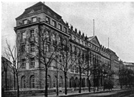
Hotel Eden Kurfürstendamm 246-247 February 1914