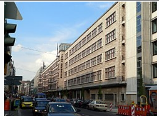
Nürnberger Straße, Richtung Tauentzienstraße