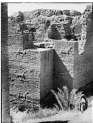
آنچه که در حفاری‌های دهه ۱۹۳۰ باقی‌مانده بوده است