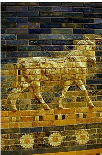
تصویر گاوئ شاخدار در بالای ردیفی از گل‌ها (آجرهای مفقود شده جایگزین شده‌اند)