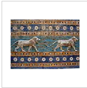
نقش دو شیر در میان ردیف گل‌ها