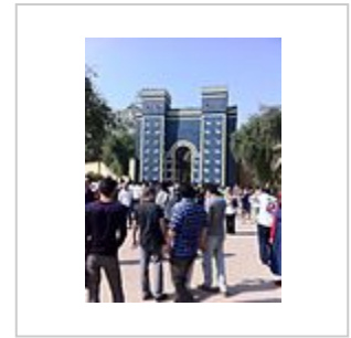
نمونه ساخته شده در عراق، ۲۰۱۱