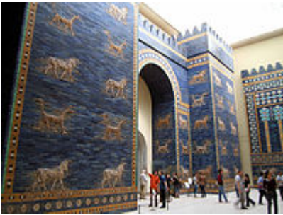
بقایای بازسازی شده دروازه ایشتار در موزه پرگامون، برلین