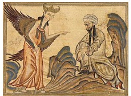
ଦିବ୍ୟଦୂତ ଗାବ୍ରିଏଲଙ୍କ ଠାରୁ ପ୍ରଥମ ପ୍ରକାଶନ ପାଇଥିବା ମହମ୍ମଦ । ୧୩୦୭ ମସିହାର ରସିଦଲ୍ଲିନ ହମାଦାନୀଙ୍କ ପାଣ୍ଡୁଲିପି ଜାମିନ ଅଲ୍-ତଝରିଖରୁ ଆନୀତ ।

ଇସଲାମରେ ଦିବ୍ୟଦୂତ ବା ଫରିସ୍ତା ଉପରେ ବିଶ୍ୱାସ କରିବା ଏକ ମହତ୍ତ୍ୱପୂର୍ଣ୍ଣ ଆଧାର । ଦିବ୍ୟଦୂତ ପାଇଁ କୋରାନୀୟ ପଦ ହେଉଛି رسل - ମଲାକ୍, ମଲାକାରୁ କିମ୍ବା ତ୍ରେଧୁନି ମ-ଲ-କରୁ ଆଣାଯାଇଥିବ । ମଲାକା ଅର୍ଥ ଯିଏ ନିୟନ୍ତ୍ରଣ କରେ । [୨୪] ମ-ଲ-କରୁ ଉତ୍ପନ୍ନ ଶବ୍ଦର ଅର୍ଥ ସମ୍ପାଦକ ବା ଦୂତ । ଏହି ଶବ୍ଦଟି କେବଳ ଆଧ୍ୟାତ୍ମିକ ସୂଚୀୟ ଆୟତ୍ତପ୍ରଦାନଙ୍କ ପାଇଁ ବ୍ୟବହାର କରାଯାଏ । କୋରାନ ଉଭୟ ଦିବ୍ୟଦୂତୀୟ ତଥା ମାନବିକ ସମ୍ପାଦକମାନଙ୍କୁ ରସୁଲ କହିଥାଏ ।