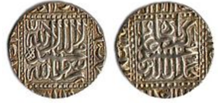
ମୋଗଲ ସମ୍ରାଟ ଆକବରଙ୍କ ରୌପ୍ୟମୁଦ୍ରାରେ ଲିଖିତ ଶହାଦା

ଇସଲାମର ଏକ ମହତ୍ତ୍ୱପୂର୍ଣ୍ଣ ଭାଗ; ଶହାଦା - ଅଶାଦୁ ଅଲ୍-ଲା' ଇଲାହା' ଇଲ୍ଲା-ଲ୍ଲାହୁ' ହା' ଅଶାଦୁ ଅନା' ମୁହମ୍ମଦନ୍ ରସୁଲୁ-ଲ୍ଲାହ' ଅର୍ଥାତ୍ " ମୁଁ ସ୍ୱୀକାର କରୁଛି ଯେ, ଆଲ୍ଲାଙ୍କ ଛଡ଼ା (ପୂଜାର ଯୋଗ୍ୟ) ଆଉ କେହି ଇଶ୍ୱର ନାହାଁନ୍ତି, ଏବଂ ମୁଁ ସ୍ୱୀକାର କରୁଛି ଯେ ମୁହମ୍ମଦ, ଆଲ୍ଲାଙ୍କ ପୈଗମ୍ବର । ମୁସଲମାନମାନେ ପ୍ରାର୍ଥନା ସମୟରେ ଏହି ବାକ୍ୟ କହିଥାନ୍ତି ଏବଂ ଅଶମୁସଲମାନଙ୍କୁ ଇସଲାମ ଗ୍ରହଣ ସମୟରେ ଏହା କହିବା ପାଇଁ ପଡ଼ିଥାଏ ।