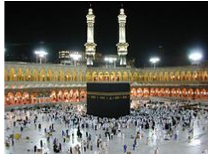
ରାତିରେ କାବା - ମୁସଲମାନଙ୍କ ପବିତ୍ରତମ ତୀର୍ଥସ୍ଥଳୀ

ଇସଲାମ (الإِسْلَام - ଅଲ୍-ଇସ୍ଲାମ୍ - ଅର୍ଥାତ୍ ଇଶ୍ଵରଙ୍କଠାରେ ସମର୍ପଣ) [୧] ଏକ ଏକେଶ୍ଵରବାଦୀ ଆବ୍ରାହମୀୟ ଧର୍ମ । [୨][୩] ଏହାର ମୂଳ ଶିକ୍ଷା ହେଉଛି ଆଲ୍ଲା ଏକ ଏବଂ ଅଦ୍ୱିତୀୟ ତଥା ମହମ୍ମଦ ଇଶ୍ଵରଙ୍କ ପୈଗମ୍ବର । ଇସଲାମ ଧର୍ମପନ୍ଥୀ ମୁସଲମାନ ଭାବେ ପରିଚିତ । [୪] ଏହାର ବିଶ୍ଵର ଦ୍ୱିତୀୟ ବୃହତ୍ତମ ଧର୍ମ ଏବଂ ଏଥିରେ ୧୮୦ କୋଟି ଲୋକ ଅଛନ୍ତି । [୫] ୪୯ଟି ଦେଶରେ ମୁସଲମାନମାନେ ସଂଖ୍ୟା ଗରିଷ୍ଠ ଅଛନ୍ତି । [୬] ଇସଲାମ ଶିକ୍ଷା ଦିଏ ଯେ - ଆଲ୍ଲା ଦୟାମୟ, ସର୍ବଶକ୍ତିମାନ ଏବଂ ଅଦ୍ୱିତୀୟ [୭] ତଥା ଭବିଷ୍ୟଦ୍ୱକ୍ତା, ଗ୍ରନ୍ଥ ଏବଂ ପ୍ରାକୃତିକ ସଙ୍କେତ ଦ୍ଵାରା ମନୁଷ୍ୟମାନଙ୍କର ପଥପ୍ରଦର୍ଶନ କରିଥିଲେ । [୮] ଇସଲାମର ପ୍ରମୁଖ ଗ୍ରନ୍ଥ ହେଉଛି କୋରାନ - ଆଲ୍ଲାଙ୍କ ମୁଖ ନିଃସୃତ ବାଣୀ ତଥା ସୁନ୍ନାଃ - ପୈଗମ୍ବର ମହମ୍ମଦଙ୍କ ନୈତିକ ଶିକ୍ଷା ତଥା ଜୀବନୀ । [୯]