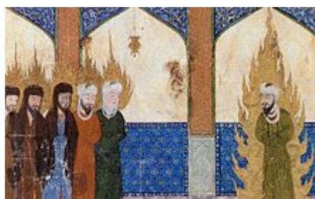
ମଧ୍ୟଯୁଗୀୟ ପାରସୀ ପାଣ୍ଡୁଲିପି - ମହମ୍ମଦଙ୍କ ସହ ଆକ୍ରାହମ, ମୁସା ଏବଂ ଯୀଶୁ ପ୍ରାର୍ଥନା ପାଇଁ ଯାଉଛନ୍ତି ।

ନବୀ (ଆରବୀୟ - نبياء - ଅନୁୀଆ) ବା ପୈଗମ୍ବର ହେଉଛନ୍ତି ଇଶ୍ୱର ବା ଆଲ୍ଲାଙ୍କ ଦ୍ୱାରା ପ୍ରେରିତ ମହାପୁରୁଷ ଯେ ଲୋକମାନଙ୍କୁ ଆଲ୍ଲାଙ୍କ ଜ୍ଞାନ, ଦିଗ୍‌ଶୈନ ତଥା ନିୟମାଦି ଦେଇଥାନ୍ତି । କୋରାନ ଅନୁସାରେ ଆଲ୍ଲା ନବୀମାନଙ୍କଦ୍ୱାରା ନିଜର ଇଚ୍ଛା ପୂରଣ କରିଥାନ୍ତି । ନବୀମାନେ ମଧ୍ୟ ସାଧାରଣ ମନୁଷ୍ୟ କିନ୍ତୁ ଆବଶ୍ୟକ ସ୍ଥଳେ ନିଜର ନବୀତ୍ୱକୁ ପ୍ରମାଣିତ କରିବା ପାଇଁ ଅତ୍ୟନ୍ତ କାର୍ଯ୍ୟ କରିପାରନ୍ତି । ଇସଲାମୀୟ ବିଶ୍ୱାସ ଅନୁସାରେ ଆଲ୍ଲାଙ୍କ ସମସ୍ତ ଦୂତଗଣ ଇସଲାମର ପ୍ରଚାର କରିଥିଲେ ।