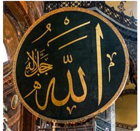
ମେଡାଲରେ ଆଲ୍ଲା ଲେଖାଯାଇଛି, ହାରିଆ ଯୋଡ଼ିଆ, ଇସ୍ତାନବୁଲ, ତୁର୍କୀ

ଇସଲାମରେ ଅନେକେଶ୍ୱରବାଦ ଏବଂ ମୂର୍ତ୍ତିପୂଜାକୁ ମହାପାପ ବୋଲି ଗଣାଯାଏ । ଏହାସହ ଇସଲାମ, ଖ୍ରୀଷ୍ଟୀୟ ବିଶ୍ୱାସ ତ୍ରେଦିବ୍ୟତାକୁ ମଧ୍ୟ ଖଣ୍ଡନ କରିଥାଏ । ଇସଲାମରେ ଆଲ୍ଲା, ସାଧାରଣ ମାନବ ବୁଦ୍ଧିରୁ ଉପରେ ବୋଲି ଗ୍ରହଣ କରାଯାଏ ଅର୍ଥାତ୍ ସାଧାରଣ ମାନବ ବୁଦ୍ଧିଦ୍ୱାରା ଆଲ୍ଲାଙ୍କ ବାସ୍ତବିକତା ବୁଝିବା ଅସମ୍ଭବ ଅଟେ । [୧୬][୧୭] ଆଲ୍ଲାଙ୍କୁ ବିଭିନ୍ନ ବିଶେଷଣାତ୍ମକ ନାମରେ ସମ୍ବୋଧନ କରାଯାଏ, ଯେପରିକି - ଅର୍-ରହମାନ ଅର୍ଥାତ୍ ପରମକରୁଣାମୟ, ଅର୍-ରହିମ୍ ଅର୍ଥାତ୍ ପରମଦୟାଳୁ । [୧୮]